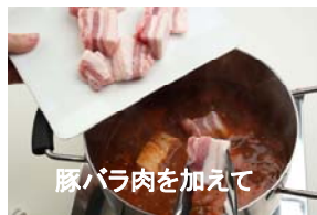
豚バラ肉を加えて