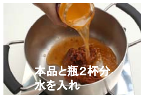
本品と瓶2杯分 水を入れ