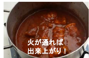
火が通れば 出来上がり！

本商品は簡単に本格ポークビンダルカレーが作れるのはもちろんのこと、風味が活きるビン詰め濃縮ペーストなので、レトルトカレーや固形ルーでは出せないフレッシュ感と本格感が特徴です。